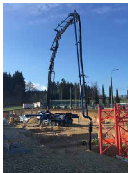
AUTO POMPE 47 MÈTRES