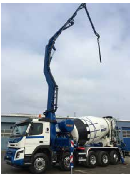
MALAXEUR POMPE 28 MÈTRES