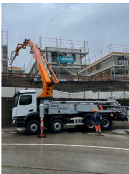
AUTO POMPE 42 MÈTRES